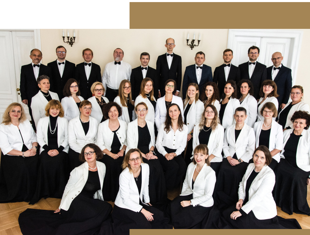
Warszawski Chór im. św. Jana Pawła II